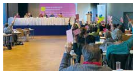
Die Delegierten im Aurelium bei der Abstimmung zur Satzungsänderung