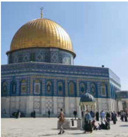
Felsendom in Jerusalem