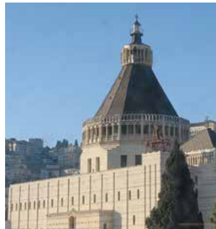
Verkündigungsbasilika in Nazareth