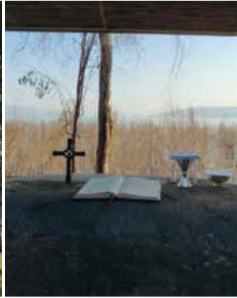
Ort der Brotvermehrung