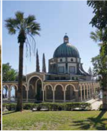
Berg der Seligpreisungen