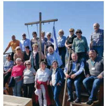
Bootsfahrt auf dem See Gennesaret